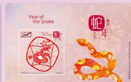
所有圖像只供參考