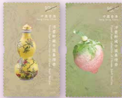
所有圖像只供參考

發行日期：2025年4月24日 首輪訂購截止日期：2025年3月12日 (訂購表格申請或「郵購網」網上訂購) 次輪訂購截止日期：2025年4月9日 (「郵購網」網上訂購)