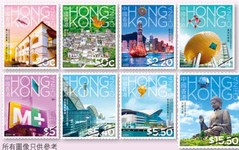
所有圖像只供參考