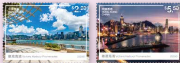
所有圖像只供參考

發行日期：2025年5月22日 首輪訂購截止日期：2025年4月9日(訂購表格申請或「郵購網」網上訂購) 次輪訂購截止日期：2025年5月7日(「郵購網」網上訂購)